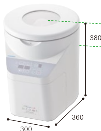
ひとひ練り (従来機)

ひとひ練りLite : W254×D310×H353mm ひとひ練り(従来機) : W300×D360×H380mm